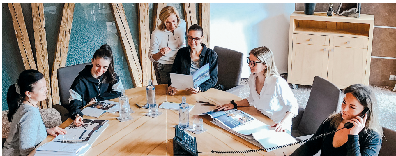
Besprechung zum Weltfrauentag im STOCK resort